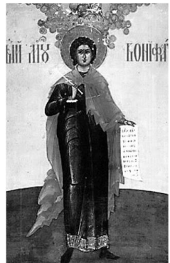
San Bonifacio di Tarso

I SANTI DI GHIACCIO (dall' 11 al 14 maggio)